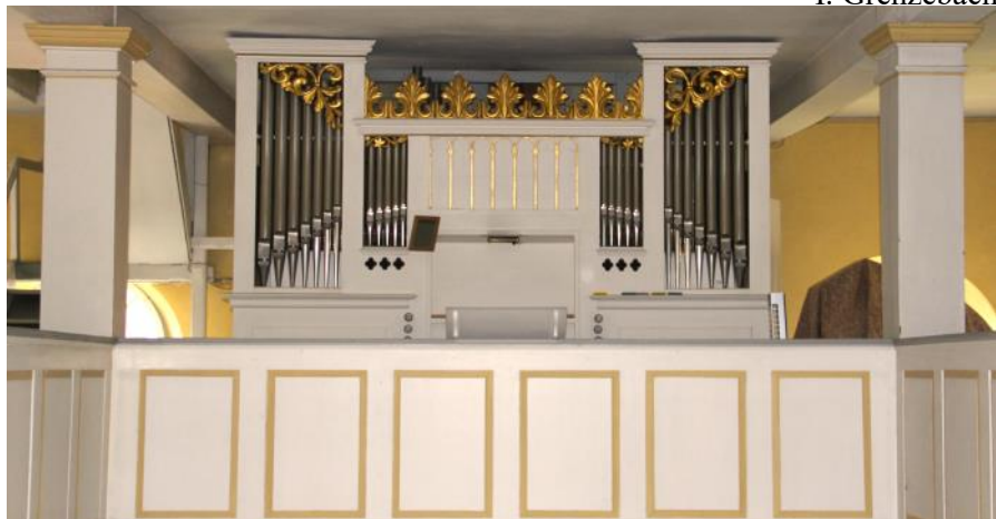
Orgel in Adelshausen