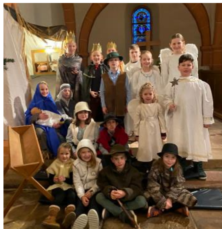
Krippenspiel Mörshausen

In Adelshausen vergießen die Engel Engelstränen, weil sie das