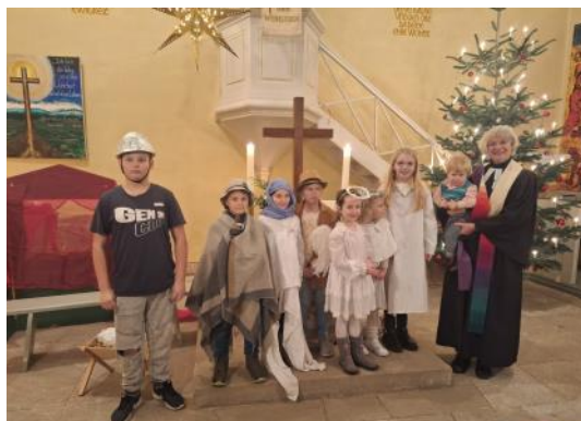
Krippenspiel Adelshausen

Leid der Menschen auf der ganzen Welt sehen.