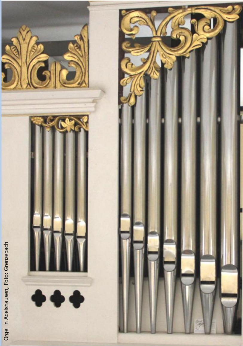
Orgel in Adelshausen, Foto: Grenzezbach