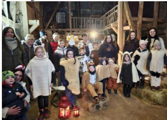
Krippenspiel Bergheim