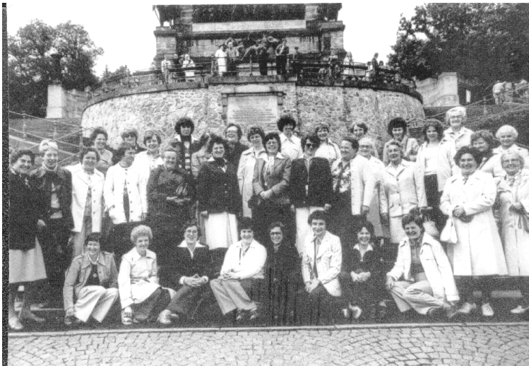
Landfrauen in Rudesheim 1978