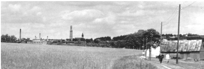
Ansicht von Nassengrub im Sudetenland

Nur wer das schreckliche Schicksal der Enteignung, Vertreibung, Entwürdigung erlitten hat, wer alles verlassen musste, was über Generationen aufgebaut wurde, wer mit Gewalt von Heimat und geliebten Menschen getrennt wird, dem brennt sich das unauslöschlich in die Seele ein“.