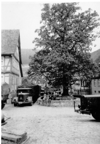
Militärautos an der Linde

zeuge mit ihren Bordwaffen an, einzelne Granaten „verirrten“ sich in unser Dorf, aber es entstand kein größerer Schaden.