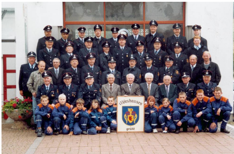
Gruppenbild zur Feier 75-Jahre freiwillige Feuerwehr Mörshausen, 2004