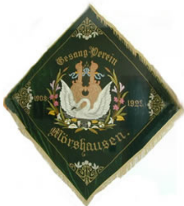
Vorder- und Rückseite der Vereinsfahne